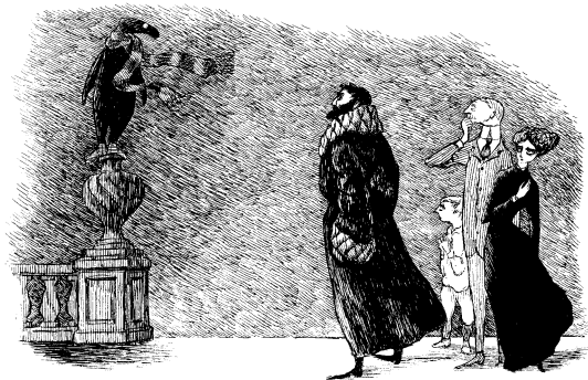
『うろんな客』原画、1957年

不思議な世界観と、モノクロームの緻密な線描で、世界中に熱狂的なファンをもつエドワード・ゴリー。貴重な原画・書籍・資料など約300点を展示し、ゴリーの多彩な制作活動にみる、謎に満ちた優雅な秘密に迫ります。