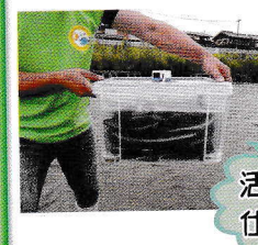
活きの良いの 仕入たよ。