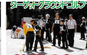
ターゲットクラフトゴルフ