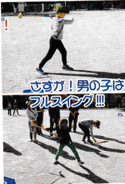
さすが！男の子は フルスイング!!!