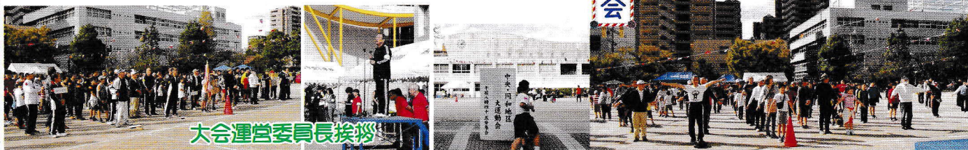
大会運営委員長挨拶