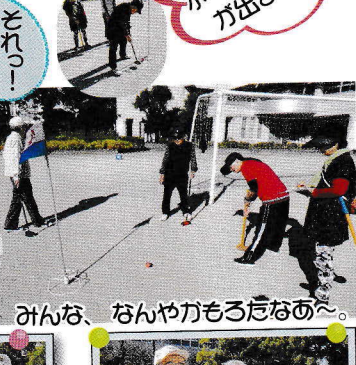
みんな、なんやかもろたなあ〜。