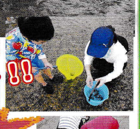
うなぎの つがひ取りだー。