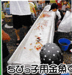
ちひさ子用金魚すくい