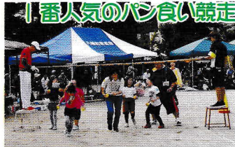
1番人気のパン食い競争