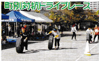
町別対抗ドライブレース