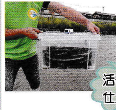
活きの良いの 仕入たま。