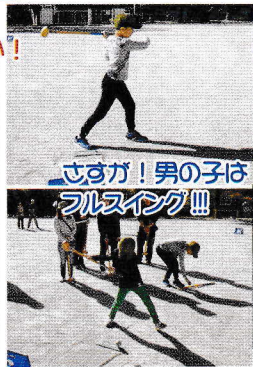
さすが！男子は フルスイング!!!