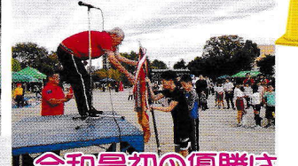
令和最初の優勝は 沖の島町でした〜!