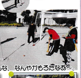
みんな、なんやかもうたあへ。