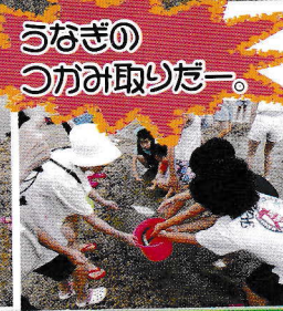
うなぎの つがみ取りだー。