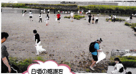
日頃の感謝を 込めて川をきれいに しよう。