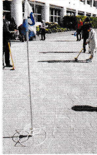
かわいいお子さん たちも元気いっぱい！