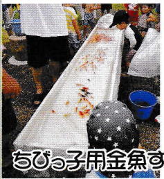
ちびっ子用金魚すくい